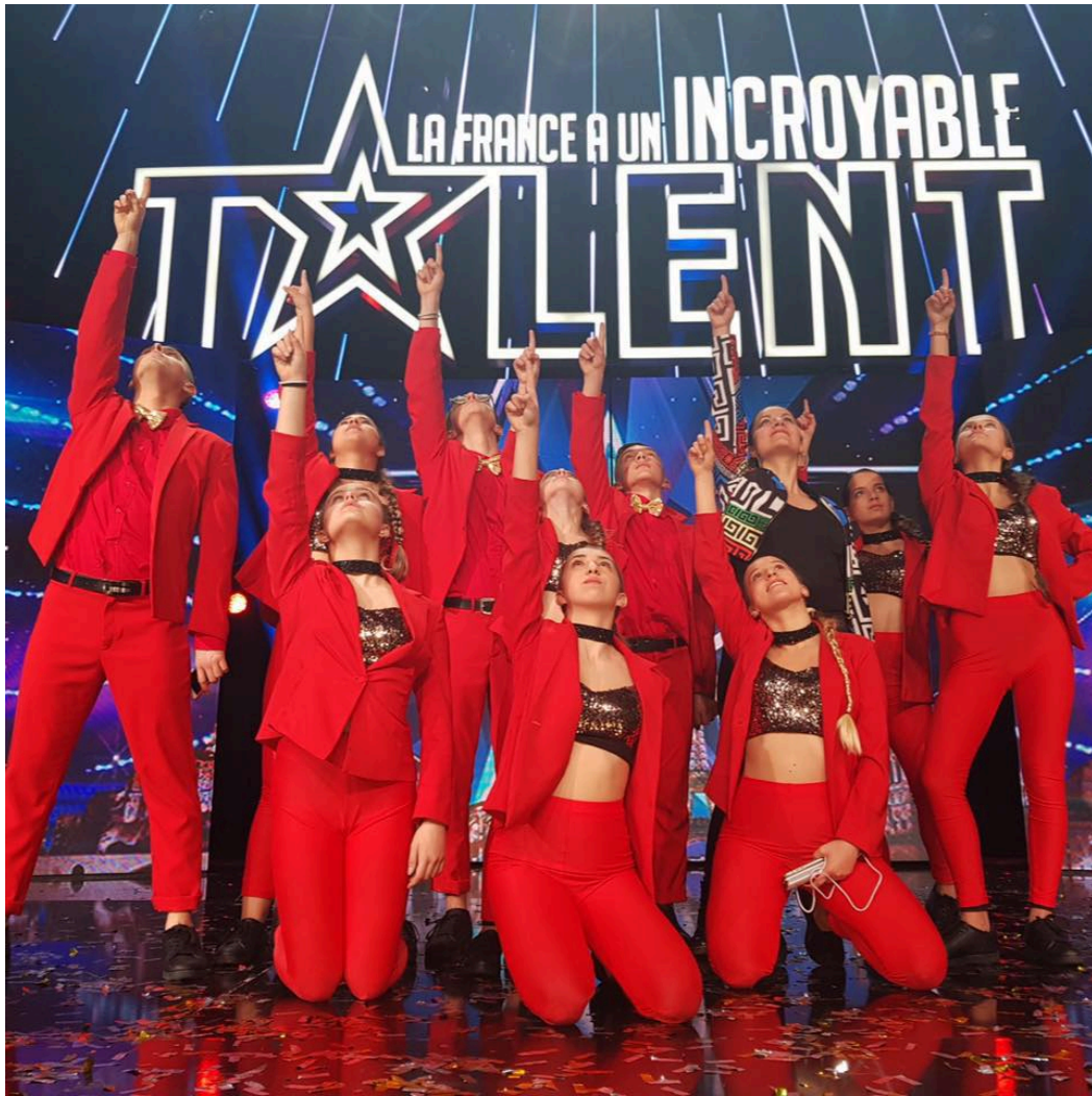
En 2018, elle réalise un show pour le spectacle de KEV ADAMS « SOIT 10 ANS TOURS ».